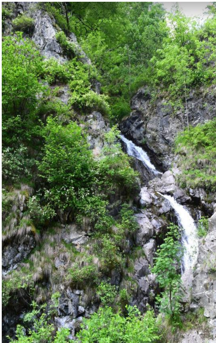
Foto: Cascada Sterminos

Timpul recomandat de parcurgere a traseului și vizitare a Cascadei Sterminos este de 3 – 4 ore.